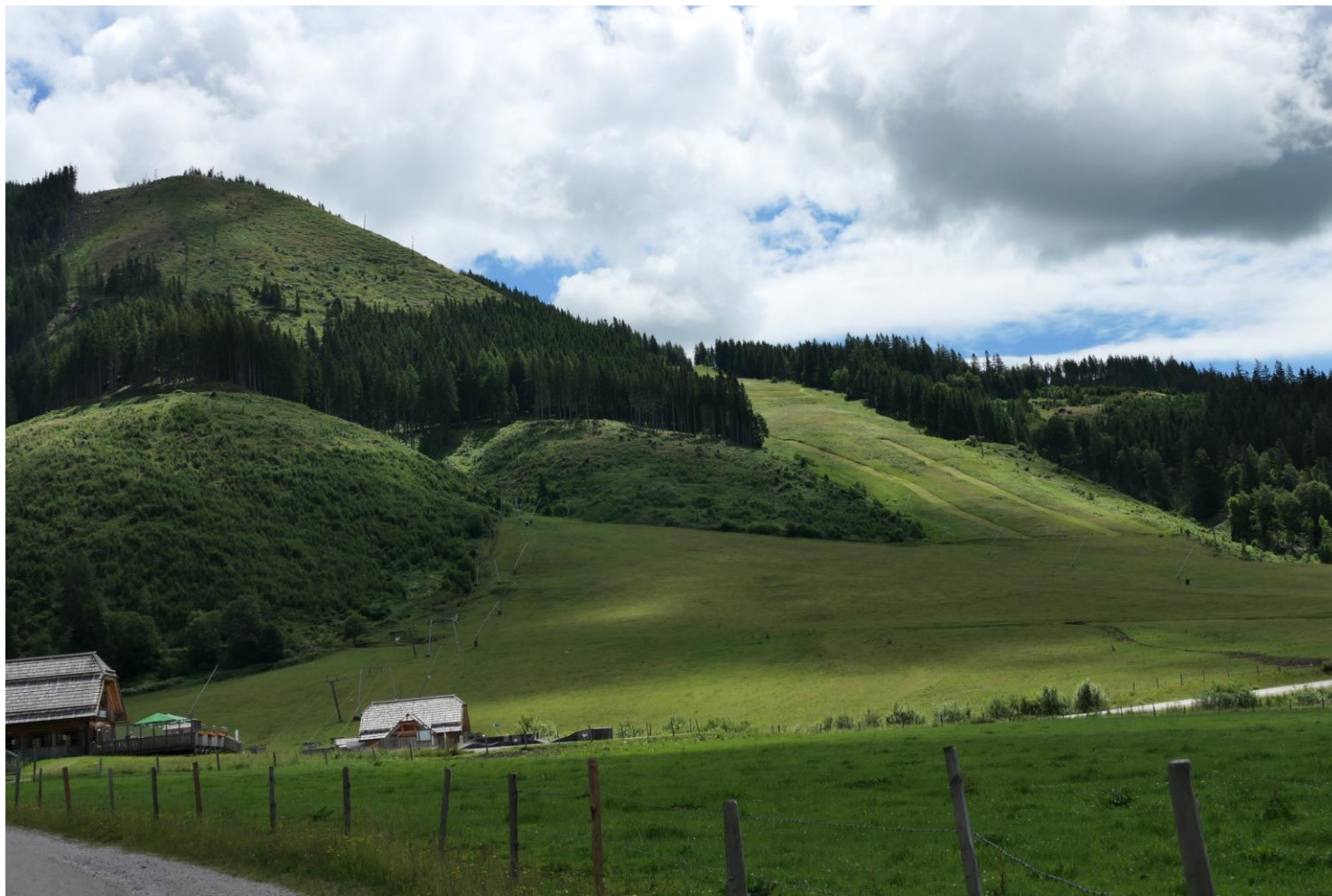
Abbildung 1: Bestandsfoto: Aufnahmestandort Schloss Kaiserau Blickrichtung SO