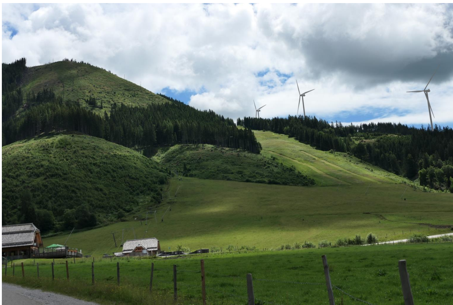
Abbildung 2: Fotomontage: Aufnahmestandort Schloss Kaiserau Blickrichtung SO „Planung“: Darstellung mit dem gegenständig geplanten Windpark Herrenwaldrücken. Brennweite 48 mm, Abstand zur nächstgelegenen WEA HWR-05 ca. 1.490 m.

Bearbeitung Fotomontage: EWS Consulting GmbH S. Sohm, August 2024